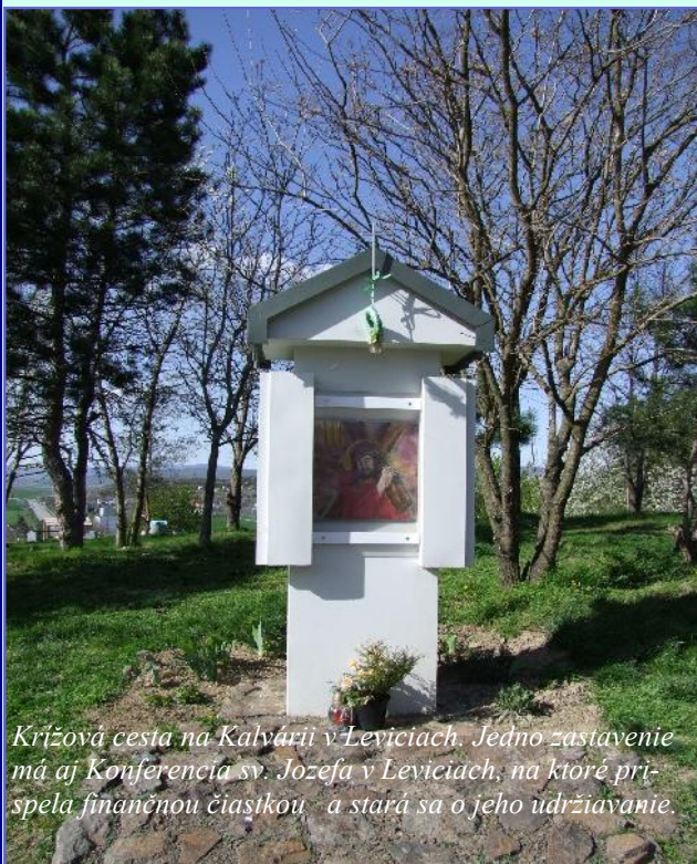
Krížová cesta na Kalvárii v Leviciach. Jedno zastavenie má aj Konferencia sv. Jozefa v Leviciach, na ktoré prispela finančnou čiastkou a stará sa o jeho udržiavanie.